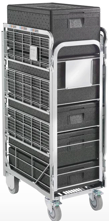
SDX® FLEXI i kombination med SDX® FUTURE.